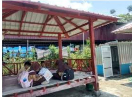
Gambar 2 Gazebo Literasi

Penyediaan gazebo dapat dikategorikan sebagai fasilitas fisik yang meningkatkan pengalam pengguna (user experience) diruang terbuka.