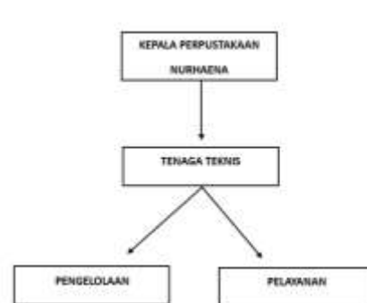
Gambar 1 Struktur Organisasi Perpustakaan Desa Batu Mila

Berikut Struktur Organisasi Perpustakaan Desa Batu Mila: