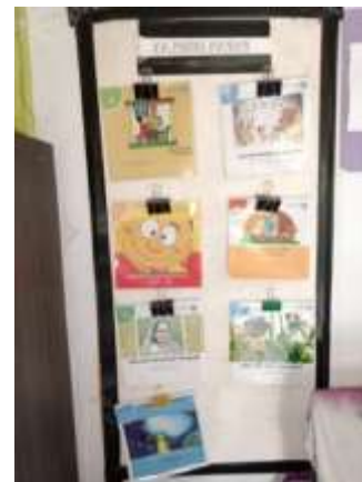
Gambar 4 Papan Display

Keberadaan papan display juga meningkatkan visibilitas aktivitas literai, sehingga mendorong partisipasi masyarakat secara luas. Informasi yang dipajang secara visual cenderung lebih muda menarik perhatian, terutama pada anak-anak dan masyarakat dengan tingkat literasi yang masih berkembang.