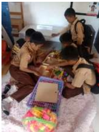
Gambar 5 Permainan Edukatif

Inovasi ini mendukung teori perpustakaan berbasis inklusi sosial, di mana perpustakaan berfungsi sebagai ruang publik yang mengakomodasi berbagai kelompok usia dan kebutuhan masyarakat.